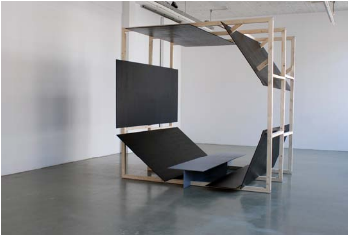
4. Drawing (inclusive picture of all possibilities) MDF, wooden beams, 2,75 x 2,75 x 2,75 m Vue d'installation Jan Van Eyck Academie, Gallery Space, NL