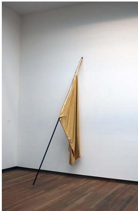
6. Covering Hand-sawn golden lamé & overcoated metal pole flag 360 x 140 cm, pole 350 cm 2010 Exhibition view, Bonnefanten Museum, Maastricht, NL, 2010