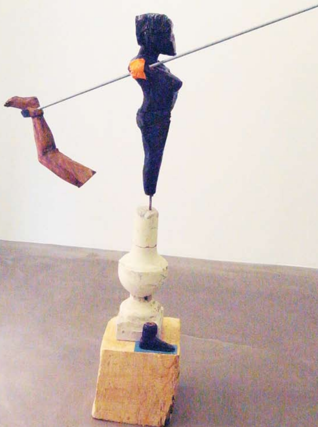
I've Seen That Face Before , 2011, bois, balustre, acier, statuette, lino, scotch, peinture bitumineuse, Vue de l' exposition Au Fil de la Bave , 2011, Galerie Alain Gutharc, Paris