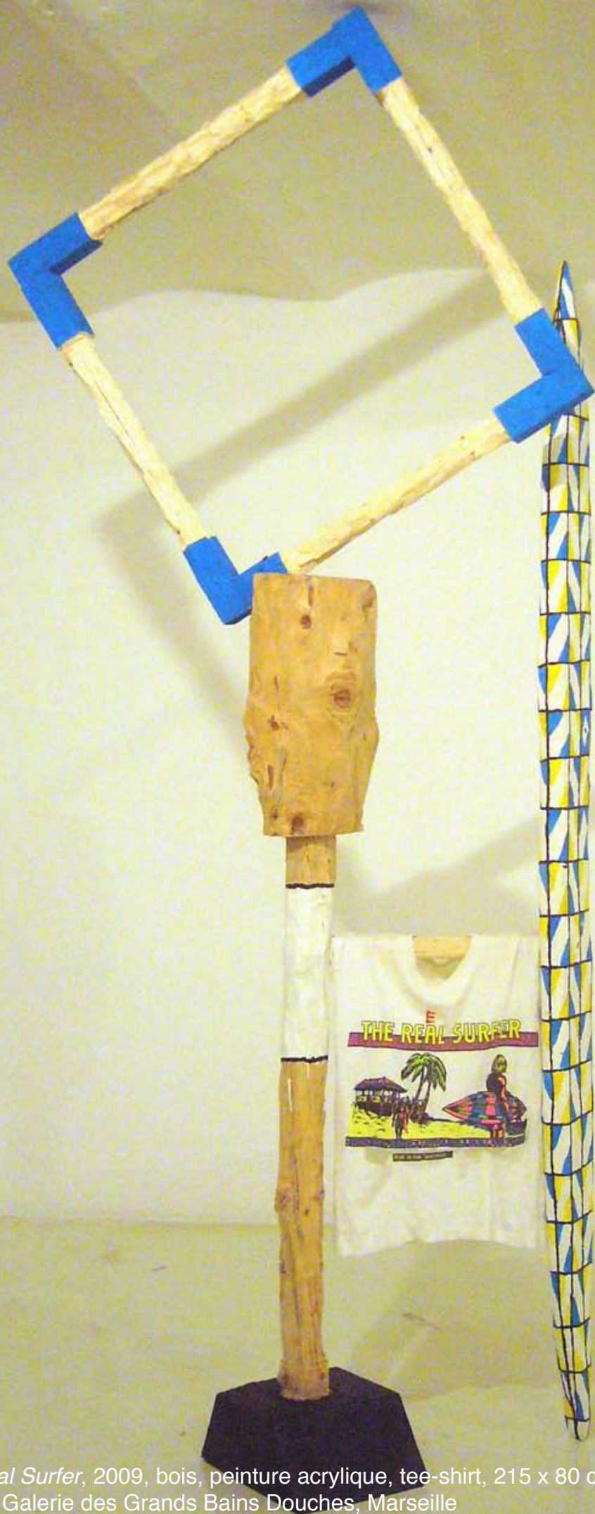
The Real Surfer , 2009, bois, peinture acrylique, tee-shirt, 215 x 80 cm, GPU 4, Galerie des Grands Bains Douches, Marseille