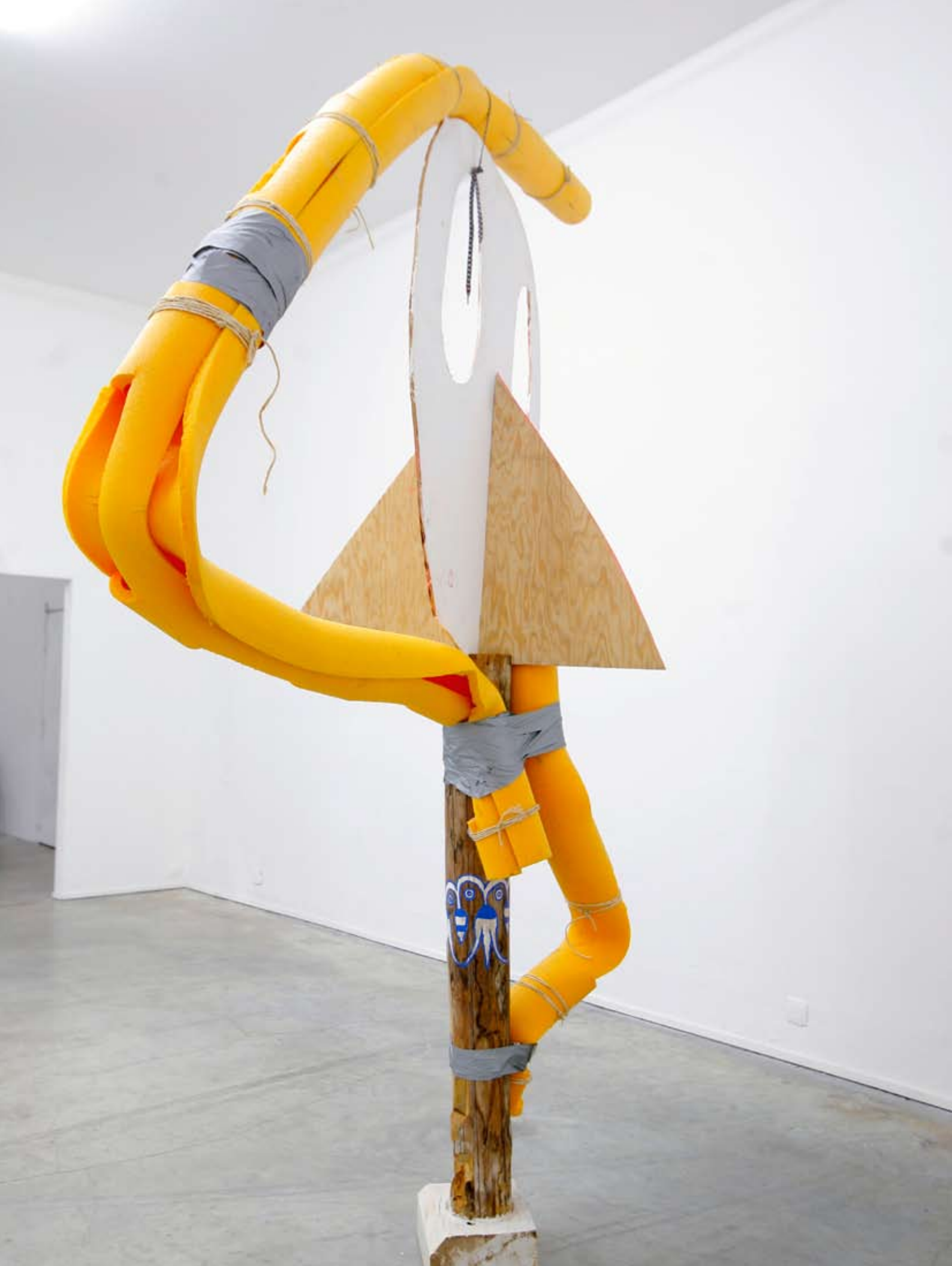
Hotel Gogodola Paris Executive Suite , 2010, bois, peinture acrylique, scotch, ficelle, mousse de protection industrielle, 270 x 150 cm, vue de l'exposition Coulis de Framboises , 2010, Palais de Tokyo, Paris