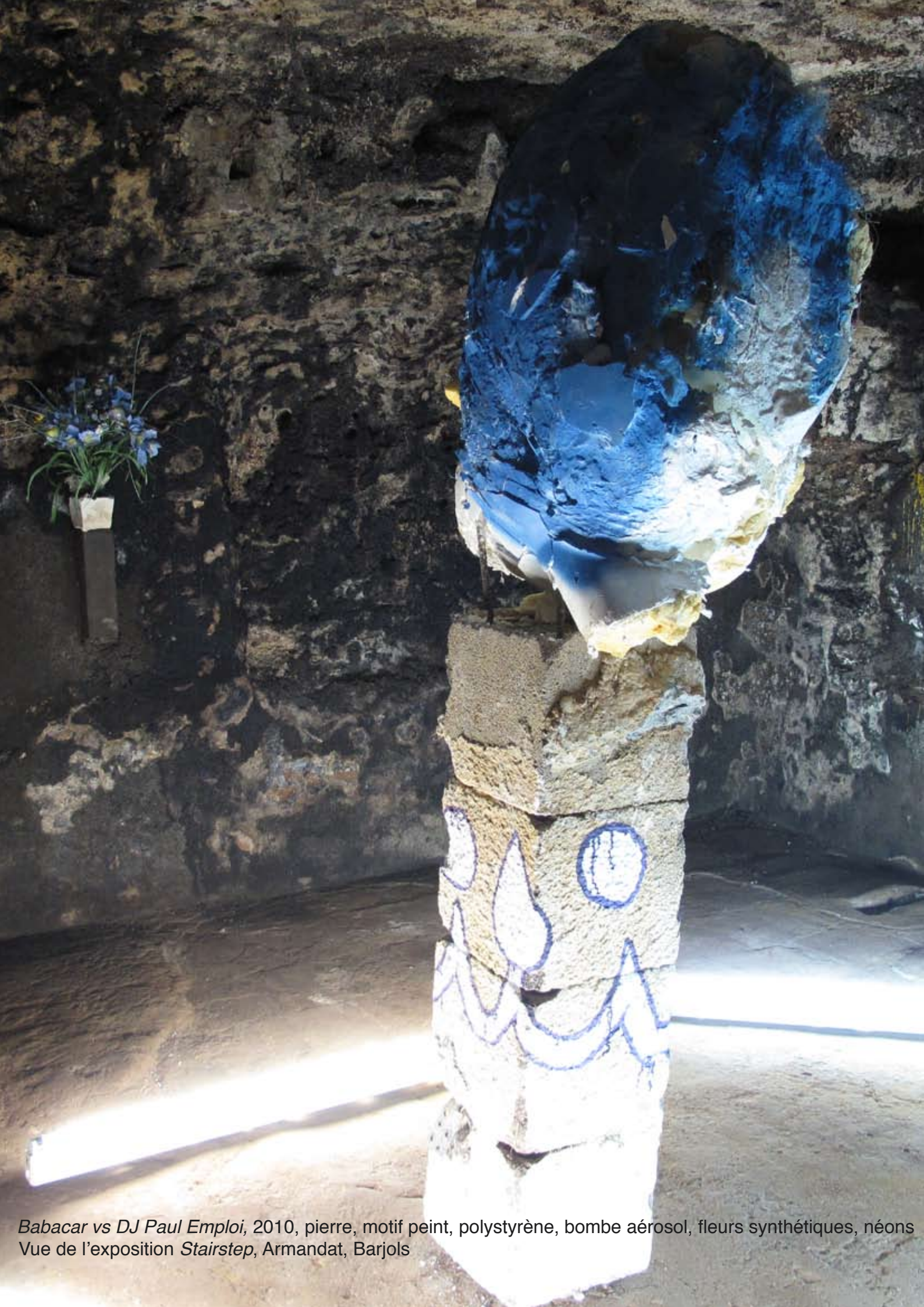
Babacar vs DJ Paul Emploi , 2010, pierre, motif peint, polystyrène, bombe aérosol, fleurs synthétiques, néons Vue de l'exposition Stairstep , Armandat, Barjols