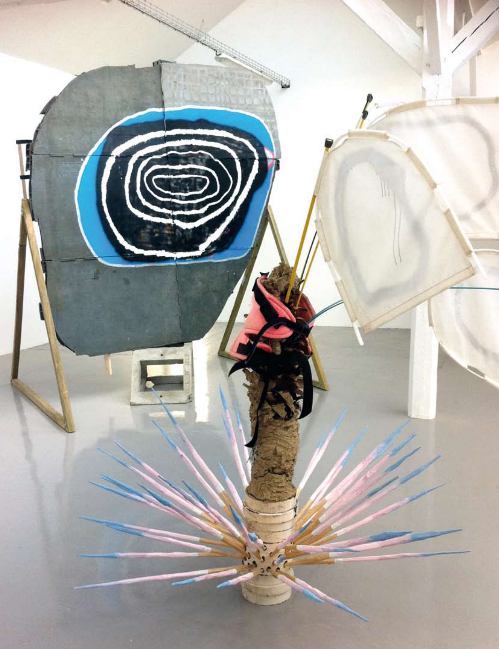
Au premier plan : Meck (Fachwerk) , 2011, bois, torchis, carbone, tissus synthétique, harnais, aérosol, peinture acrylique. Au fond : Throwing Up In Sea Water After a Mini Duck Dive , 2011, palettes industrielles en plastique, béton, bois, peinture acrylique, aérosol, pastel gras. ( Stranger By Green , 40mcube)