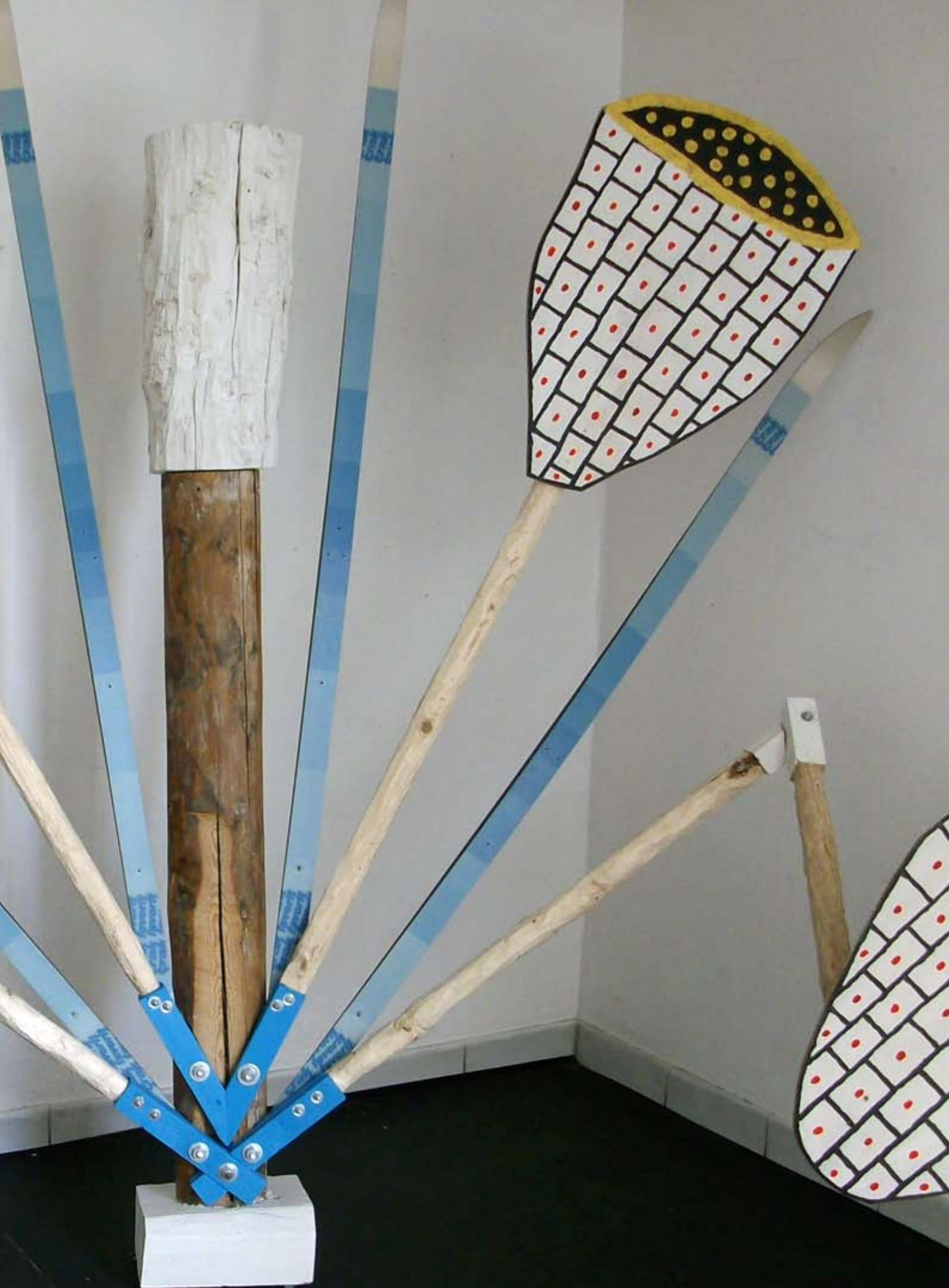
In The Laser Beams , 2009, Bois, skis de fond, peinture acrylique, 220 x 300 cm, Le Commissariat, Paris