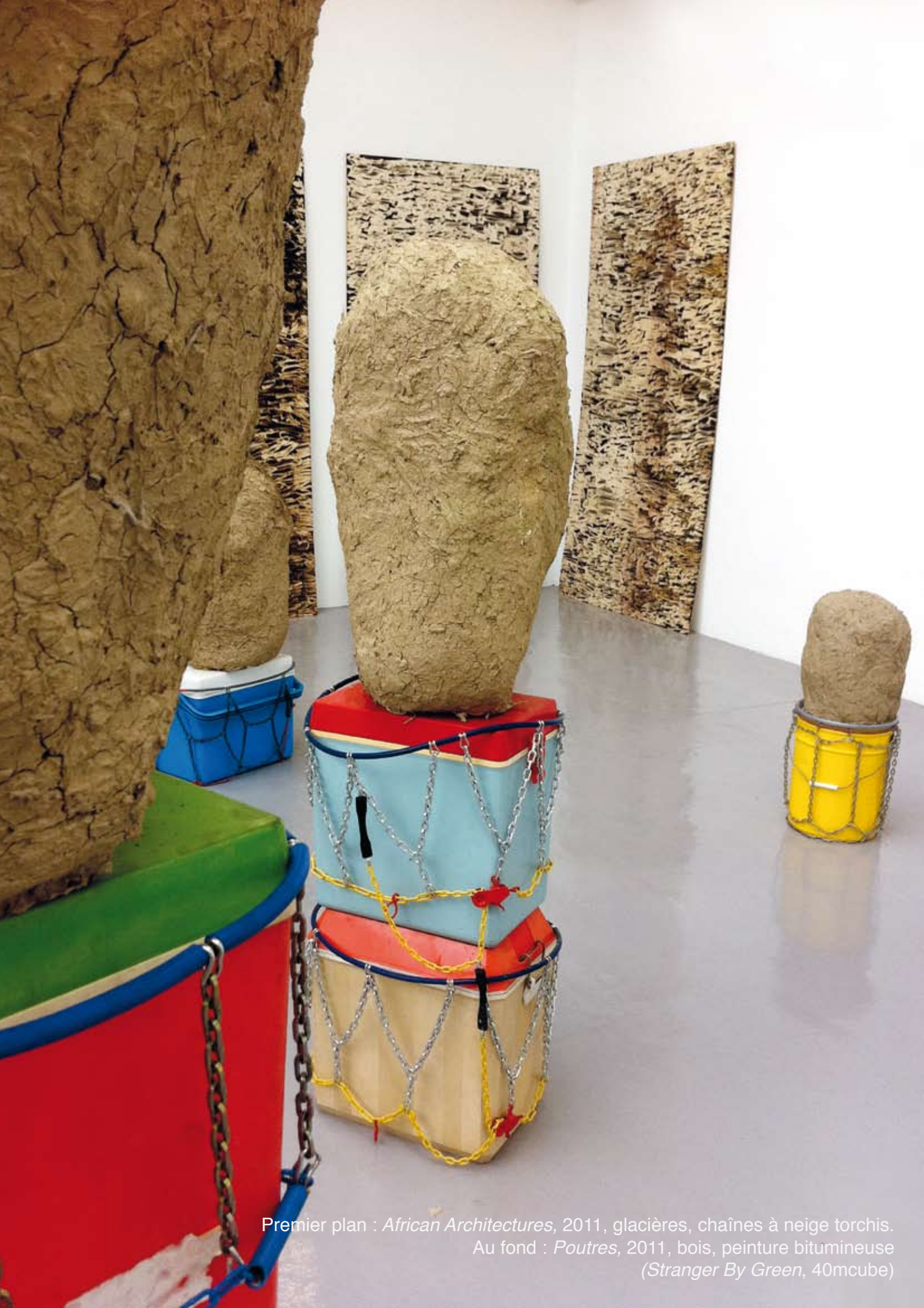
Premier plan : African Architectures , 2011, glacières, chaînes à neige torchis. Au fond : Poutres , 2011, bois, peinture bitumineuse ( Stranger By Green , 40mcube)