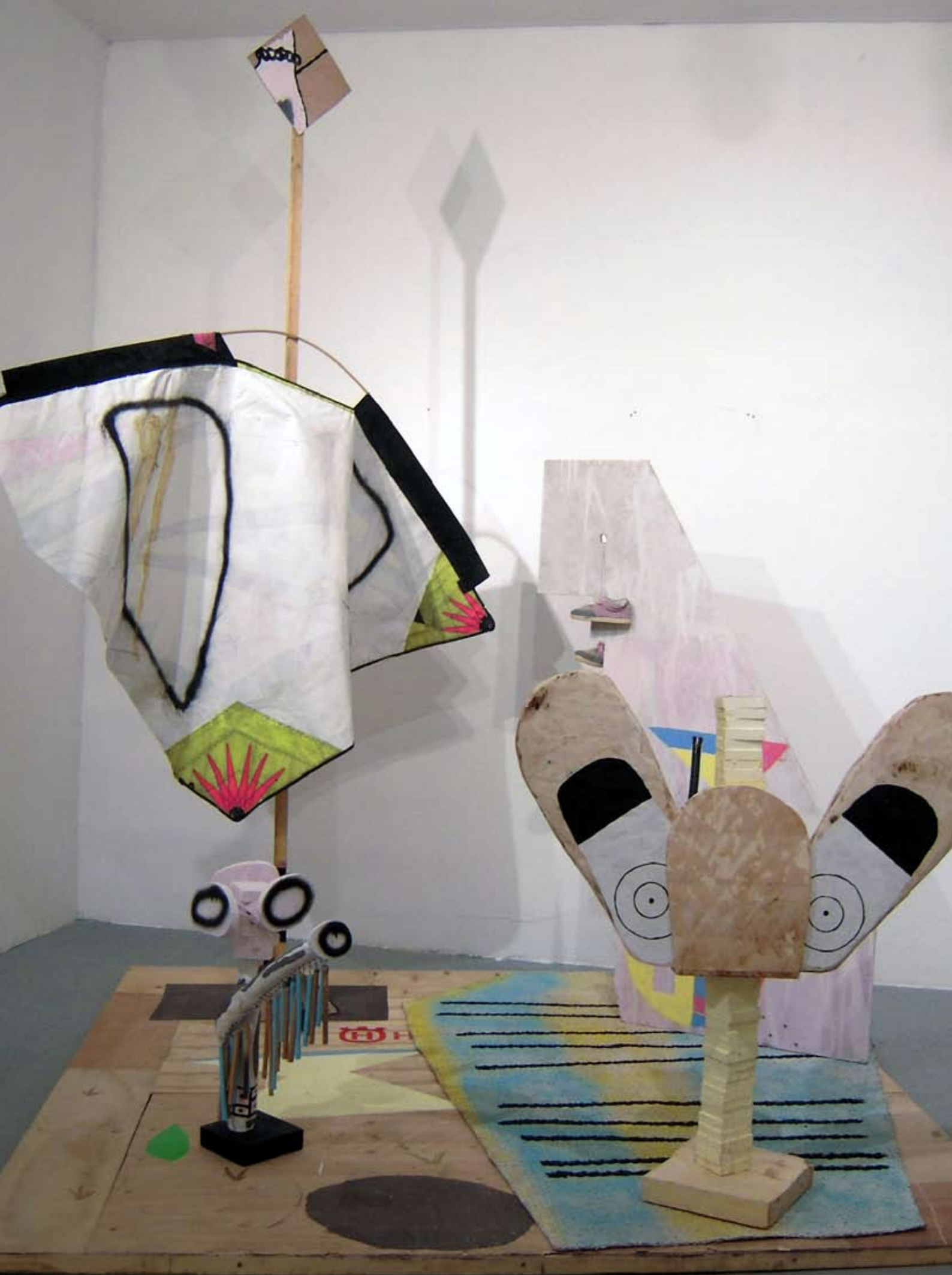
+1 (917) 400 0889, 2009, Bois divers, bambou, tapis coco, voile, chaussures, peintures acrylique et glycéro, aérosol, craie, 250 x 250 au sol / Parking Lot Dhalias , Chateau de Servieres, Marseille