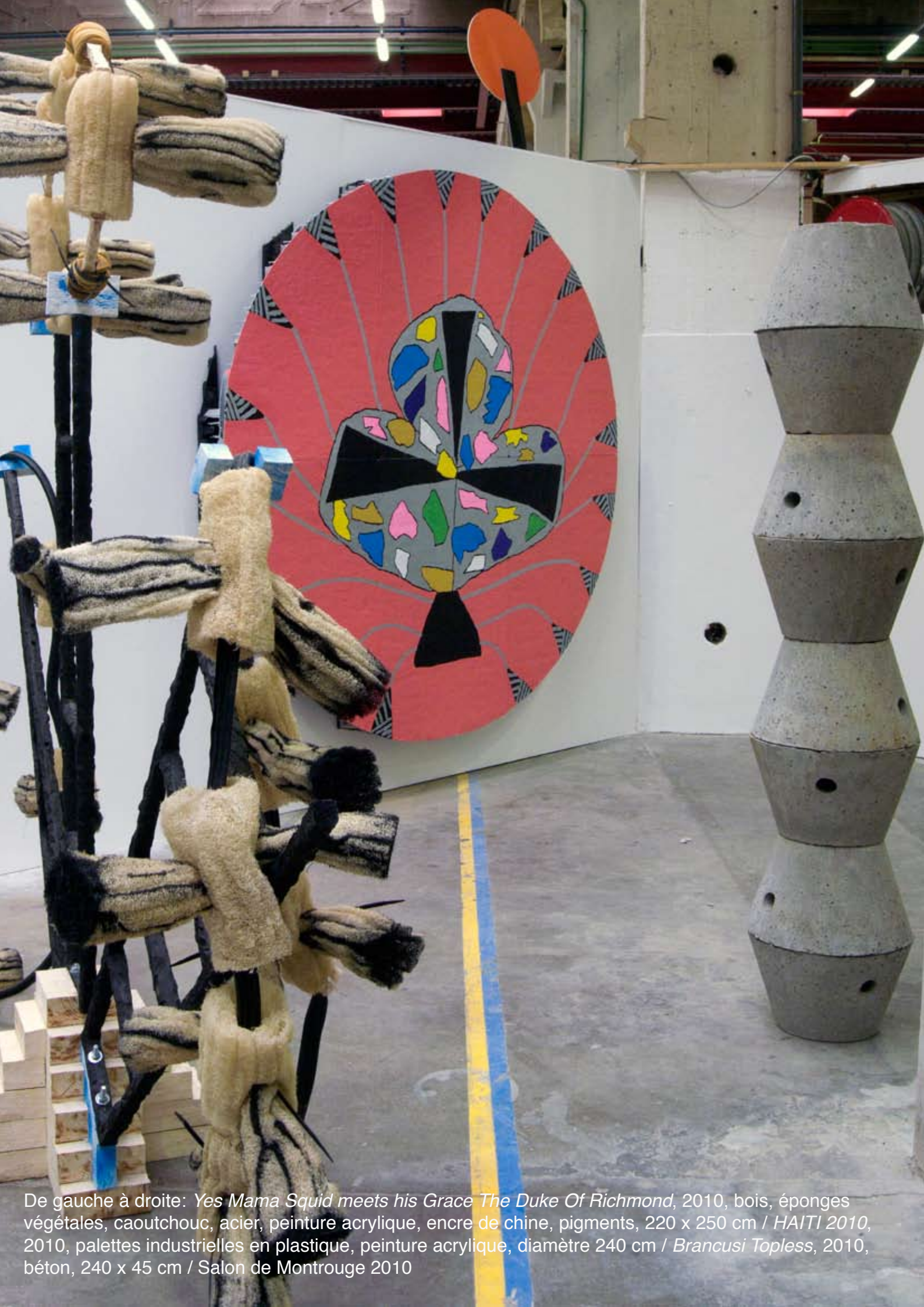
De gauche à droite: Yes Mama Squid meets his Grace The Duke Of Richmond , 2010, bois, éponges végétales, caoutchouc, acier, peinture acrylique, encre de chine, pigments, 220 x 250 cm / HAITI 2010 , 2010, palettes industrielles en plastique, peinture acrylique, diamètre 240 cm / Brancusi Topless , 2010, béton, 240 x 45 cm / Salon de Montrouge 2010