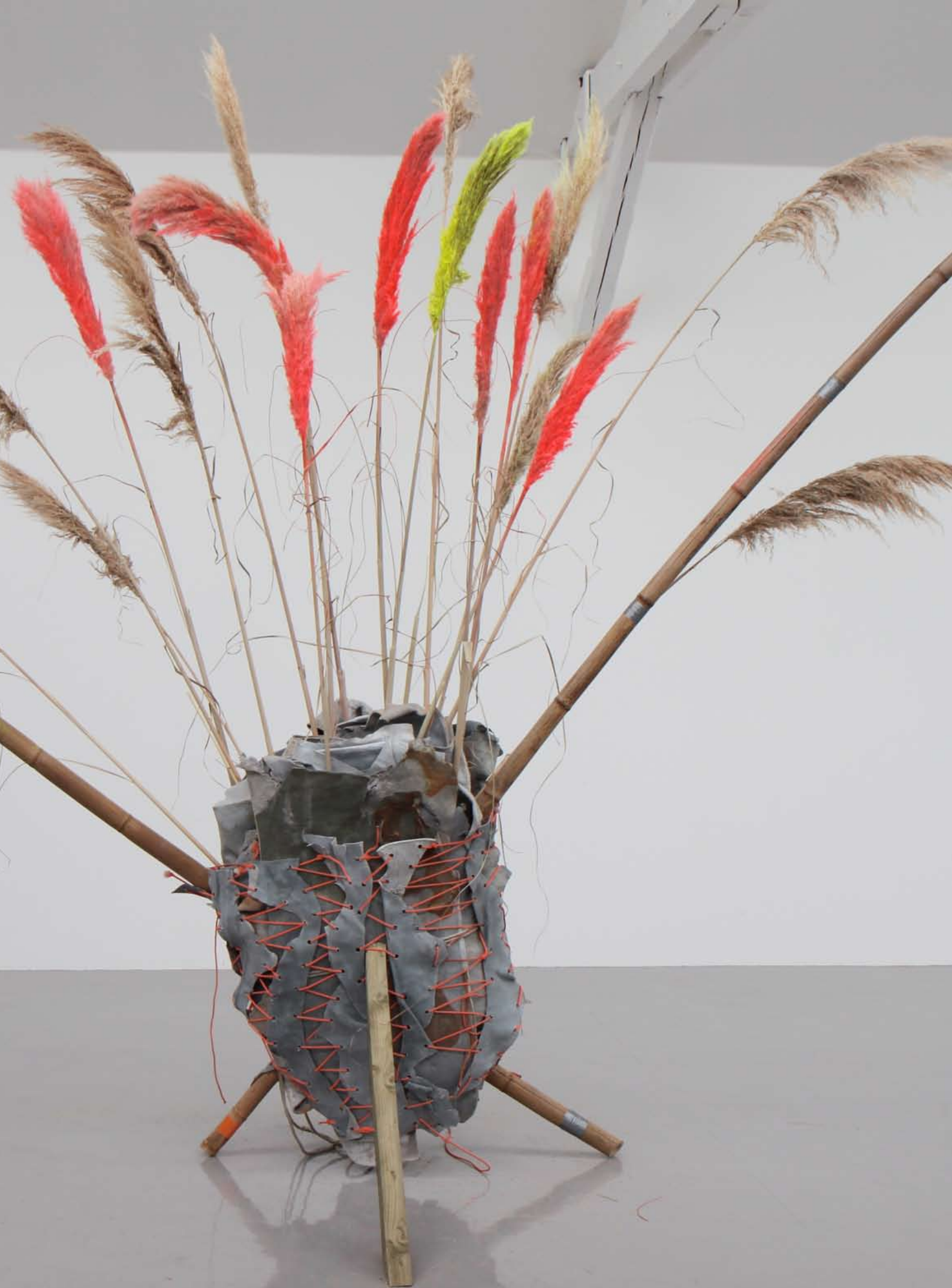
Rave Mission , 2011, bambous, cuir brut, corde nylon, bois, herbes de la pampa, pigments, 300 x 350 cm (Stranger By Green, 40mcube)