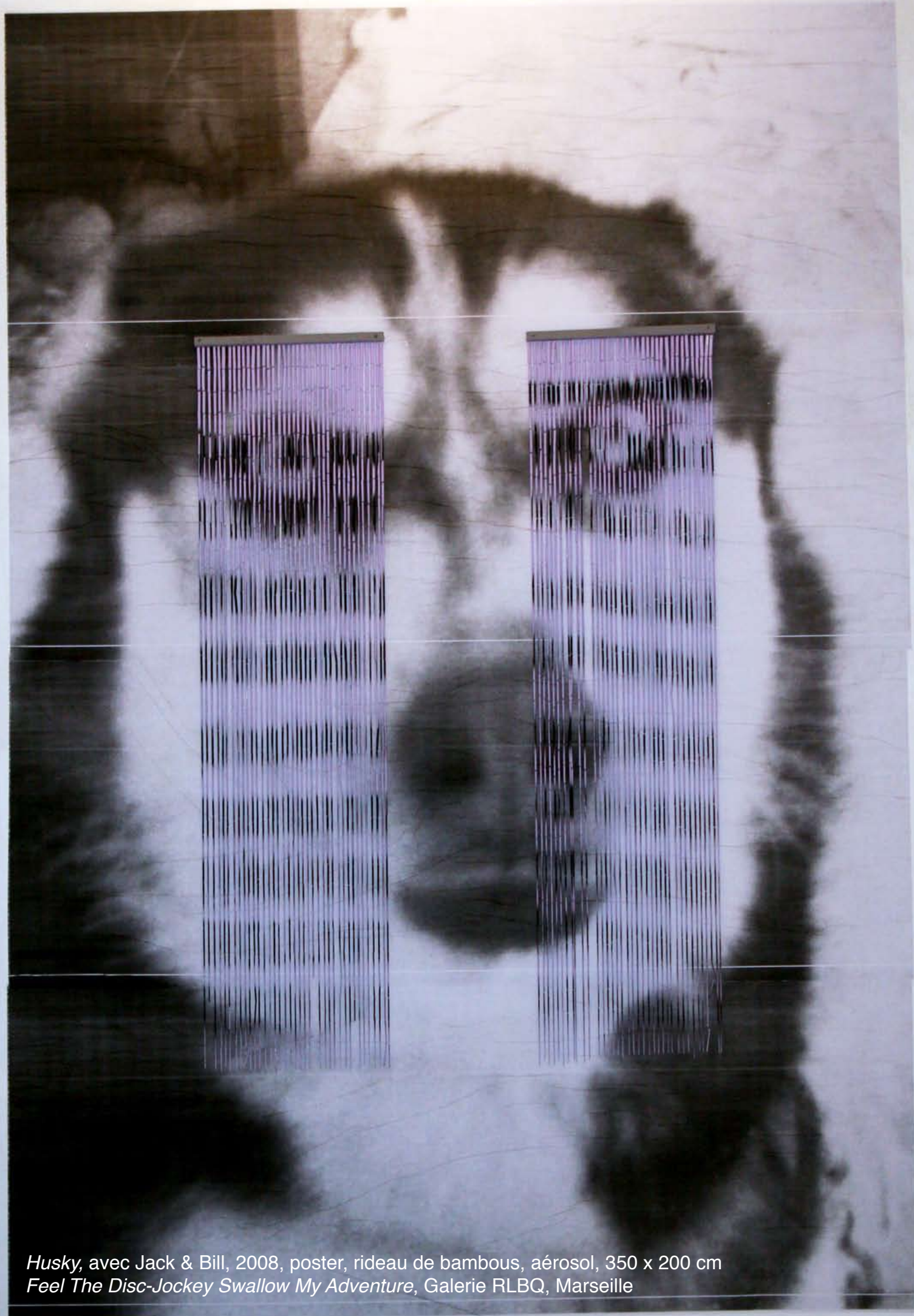
Husky, avec Jack & Bill, 2008, poster, rideau de bambous, aérosol, 350 x 200 cm Feel The Disc-Jockey Swallow My Adventure, Galerie RLBQ, Marseille