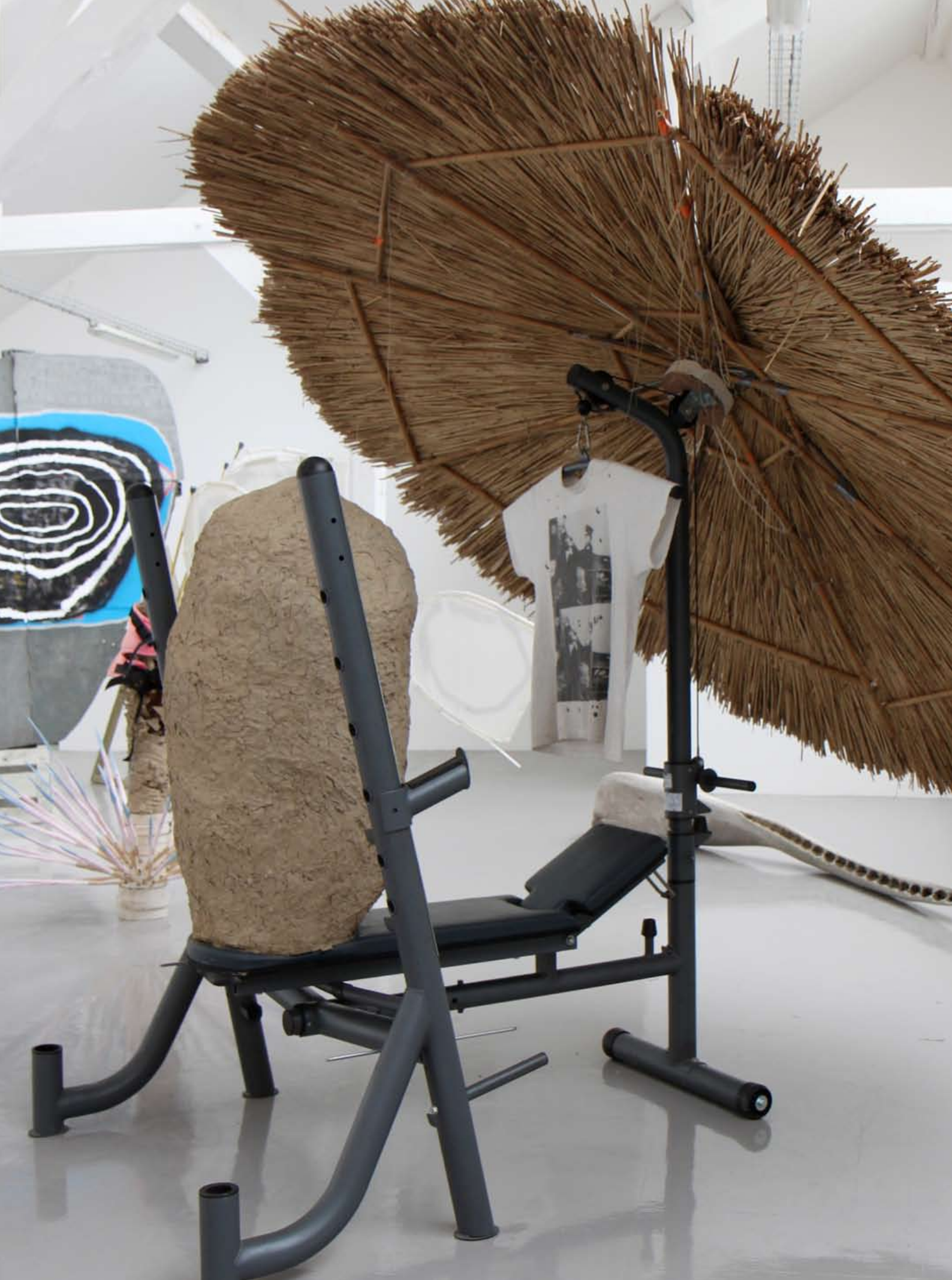
Grand Master Chief Cafe World, 2011, banc de musculation, bambous, roseaux de Hongrie, torchis, tee-shirt (Stranger by Green, 40mcube)