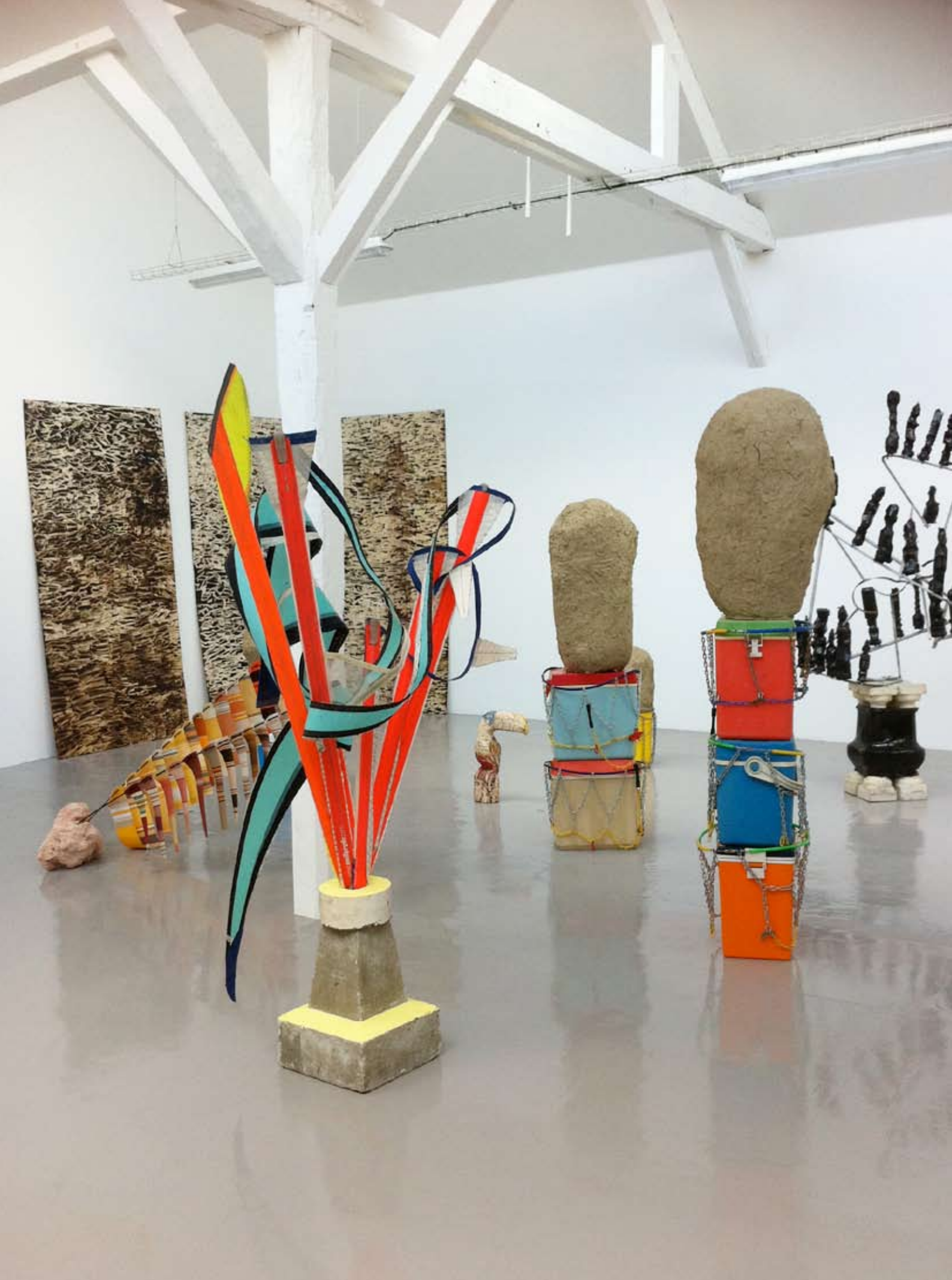
Vue de l'exposition Stranger By Green , 2011, 40mcube, Rennes