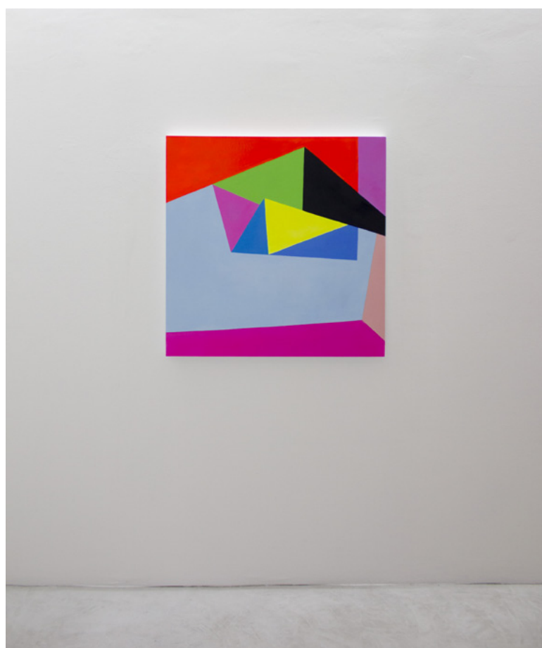
Huile sur toile ( Luna Park, Chapitre XIV, The Beekeeper's Daughter , la GAD, 2012)

Luna Park, Chapitre XIV, The Beekeeper's Daughter , 24 nov.-29 déc. 2012