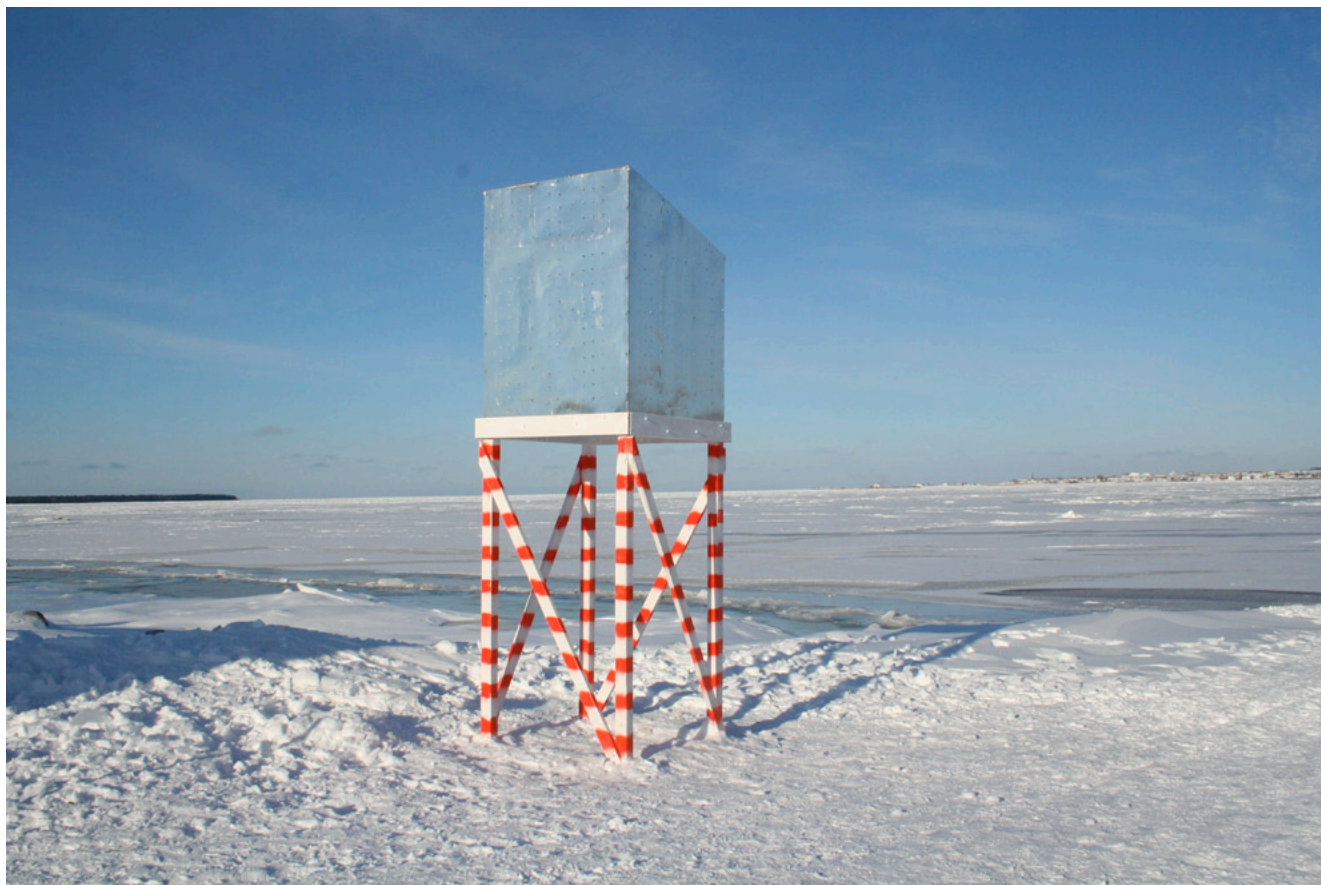
Mirador , 2006, Centre Caravansérail- La banquise, Rimouski