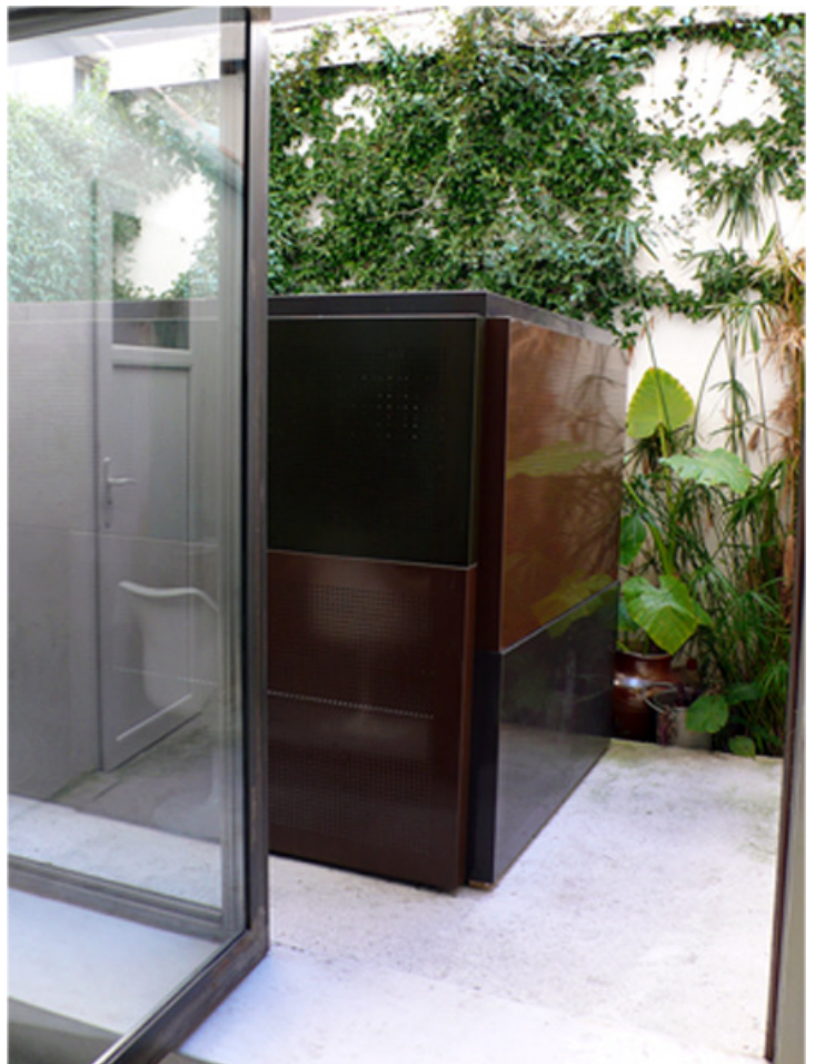
Vue de l'exposition Hivernage : Antimatière / avenue Thiers, 2009 Dimension: 240 x 140 x 160 cm, Acier galvanisé thermolaqué, Pièce unique, courtesy de l'artiste et La GAD.