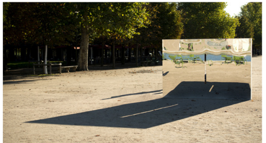
Meurtrière, 2012, Inox, concrete, 300 x 200 x 25 cm