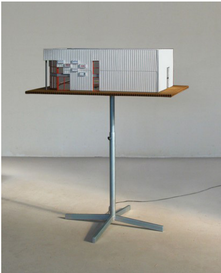
Sans titre (PME), 2005

Galvanized metal, aluminum sheet, fabric, various materials, detachable rotary system, 142 x 80 x 100 cm