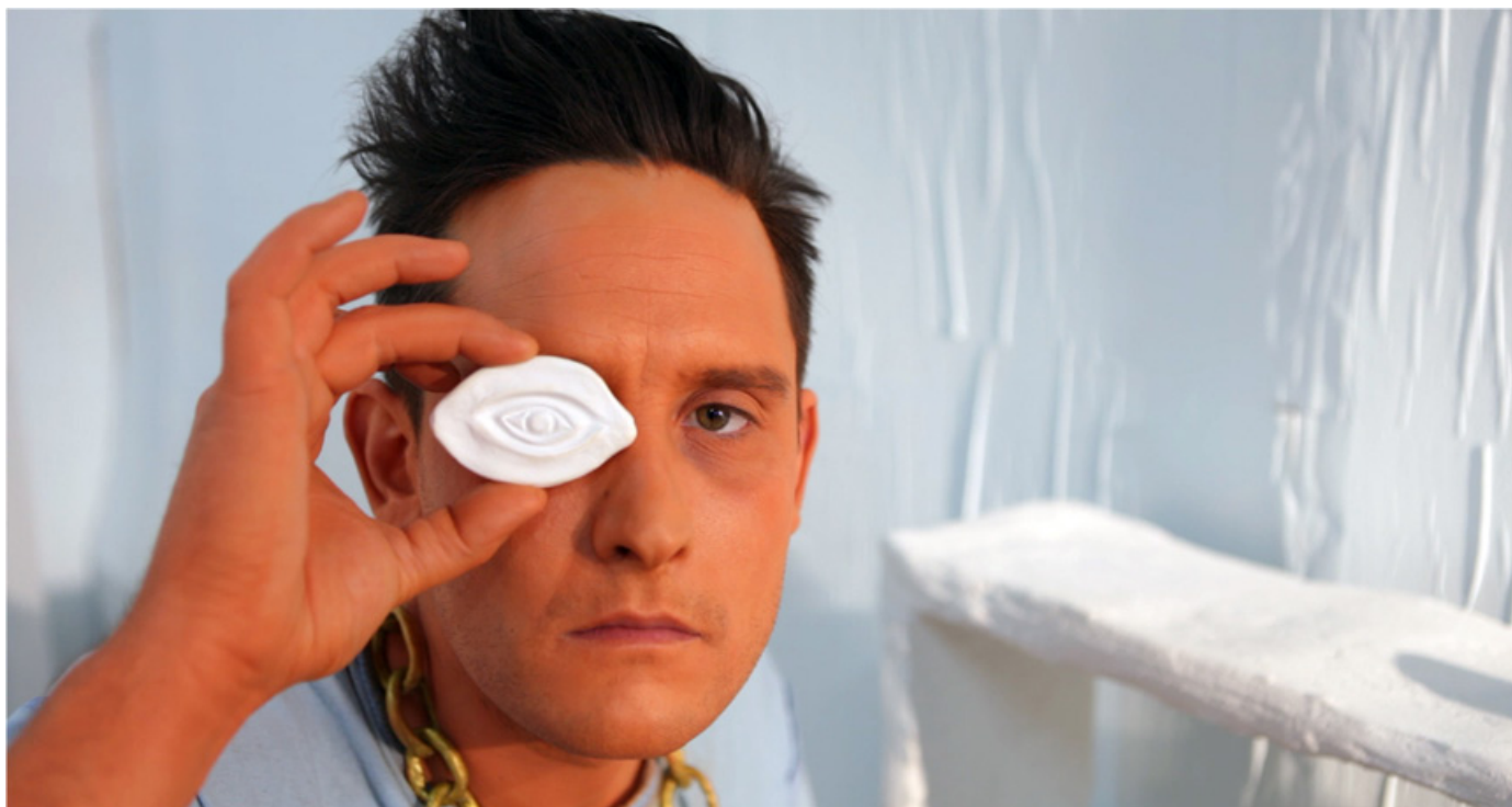
Lui et l'œil , 2012

Œuvres de BING BING représentées par La GAD