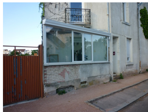
Pages de véranda slengro photographie Didier Marcel

Galvanized metal, aluminum sheet, fabric, various materials, detachable rotary system, 142 x 80 x 100 cm