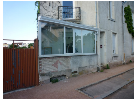
Pages de véranda slengro photographie Didier Marcel

Galvanized metal, aluminum sheet, fabric, various materials, detachable rotary system, 142 x 80 x 100 cm