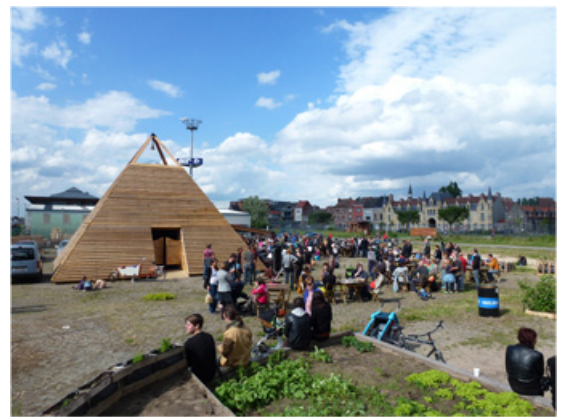
Bar, 2012, Installation in the public space, Gand, Belgium