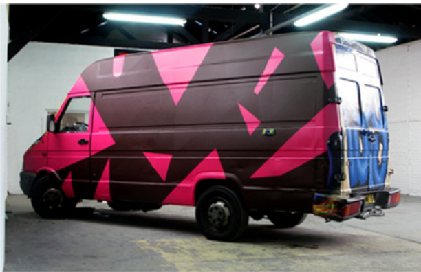
Buchard Dazzled. 2012. Stickers on vehicle.