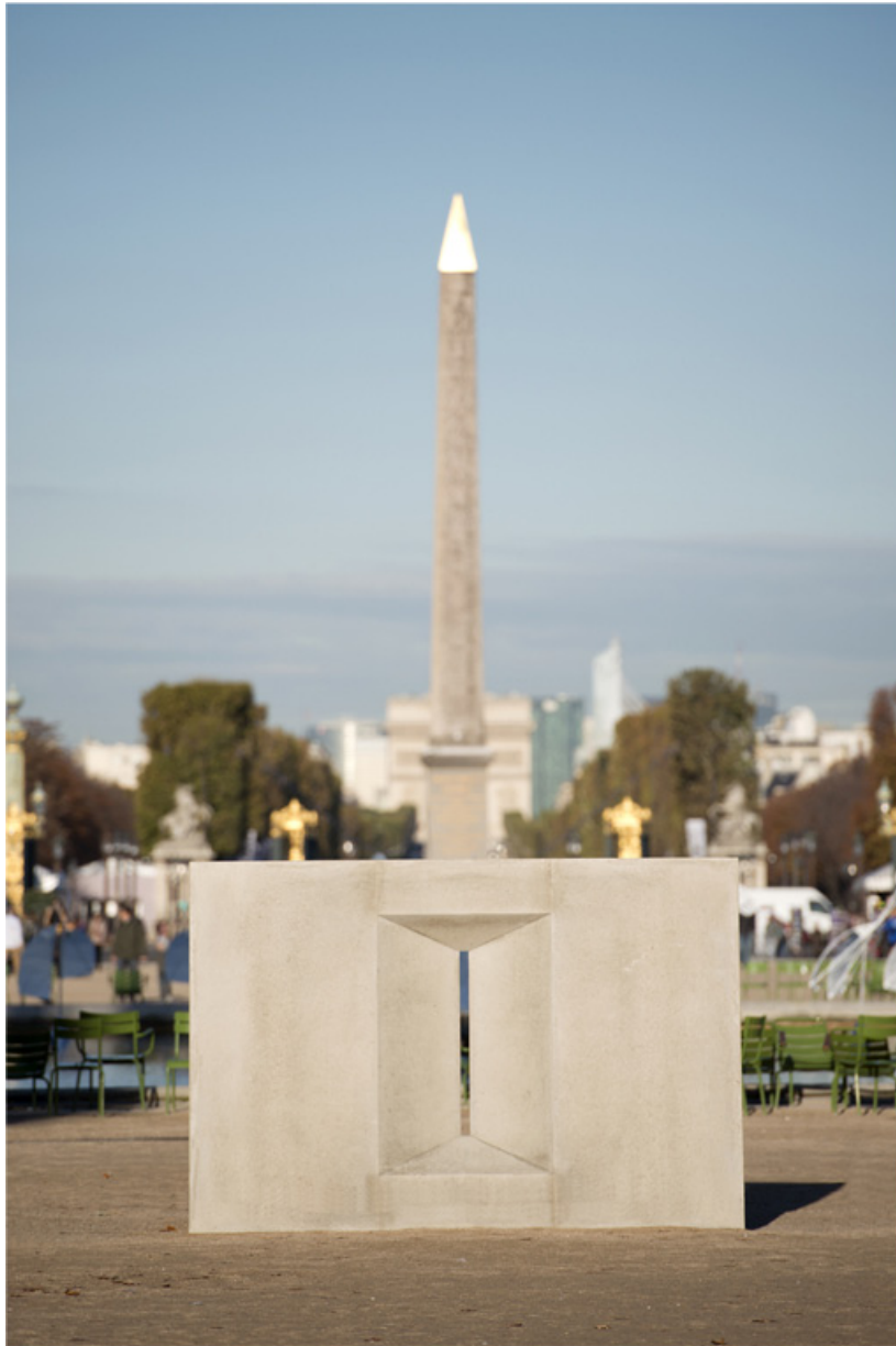
Meurtrière, 2012, Inox, concrete, 300 x 200 x 25 cm