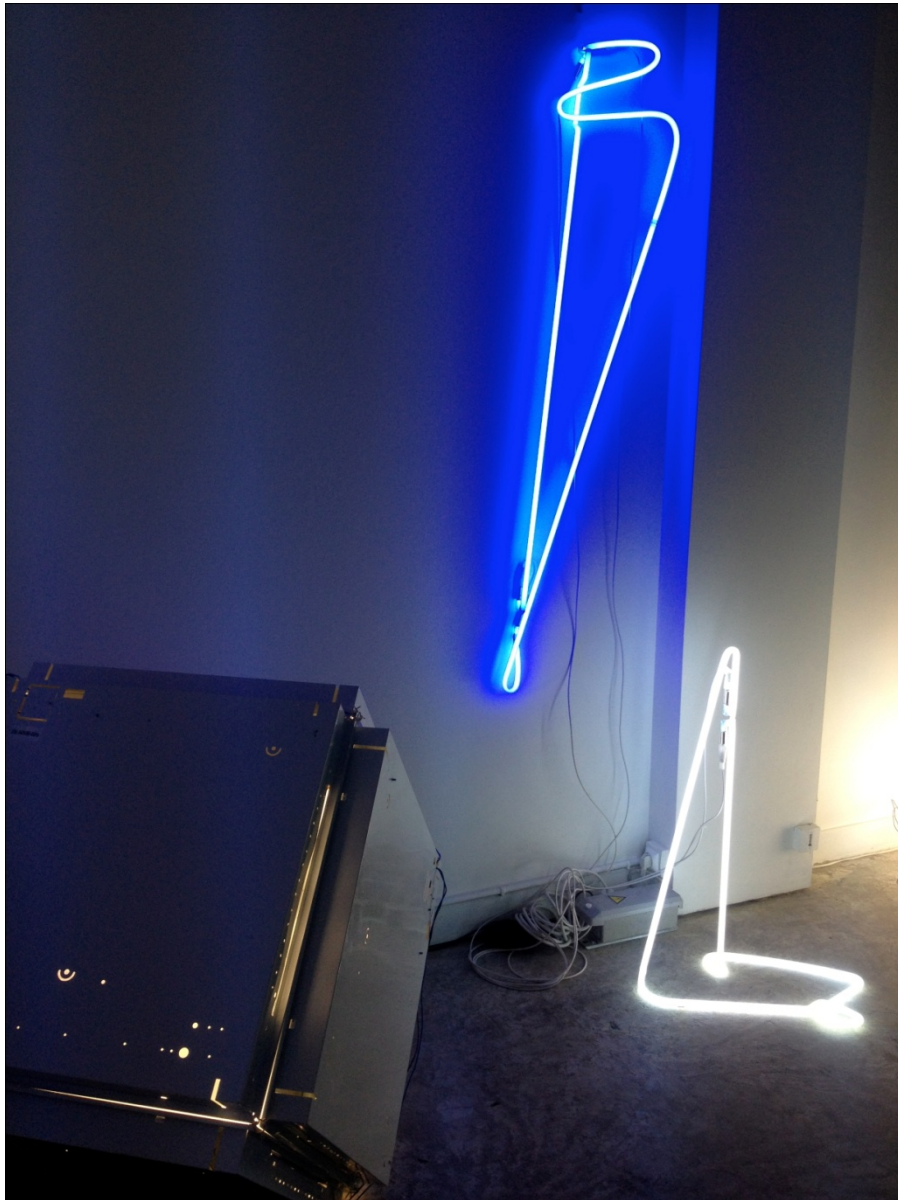
Vue de Mini Bling #01

œuvres de Ugo Schiavi, Kleber Matheus, courtesy les artistes et La GAD.