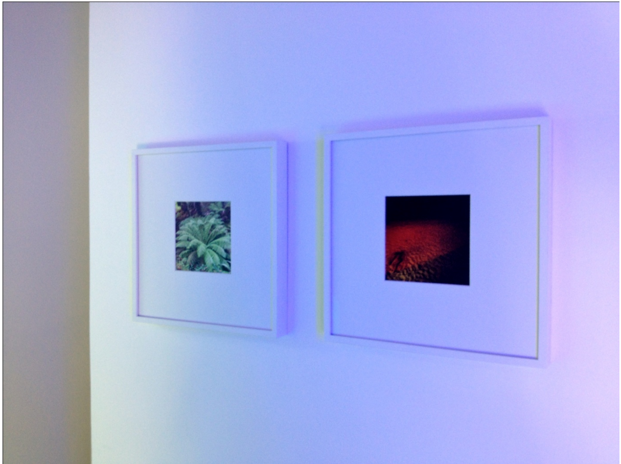
OLIVIER AMSELLEM, MA-X iPhone, OA-X iPhone (2013) 2 Tirages encadrés, Courtesy La GAD