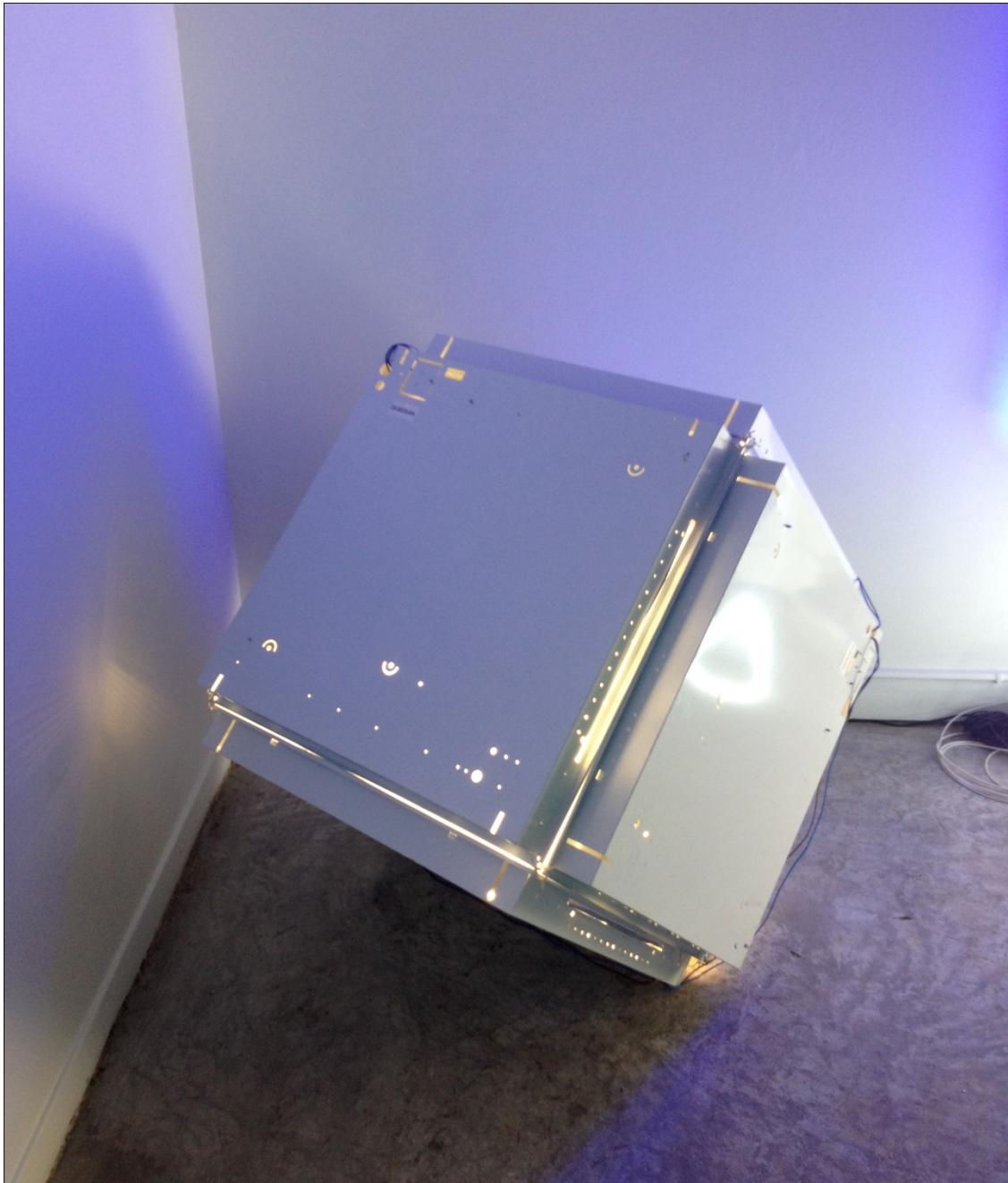
Ugo Schiavi, Light cube ( 2011), sculpture néon, pièce unique