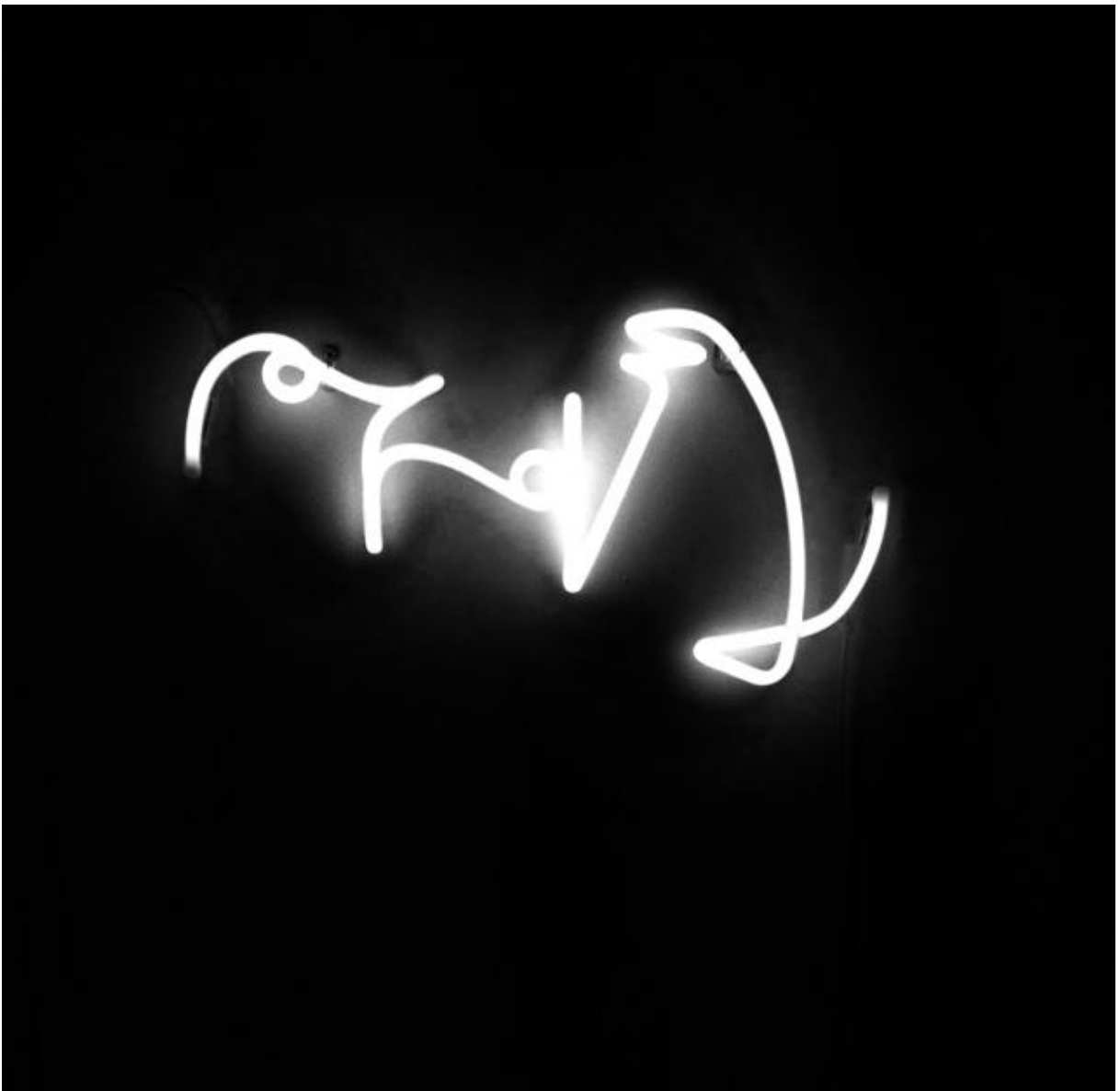
FAYCAL BAGHRICHE, La ifham (2006), sculpture néon, courtesy de l'artiste et La GAD.